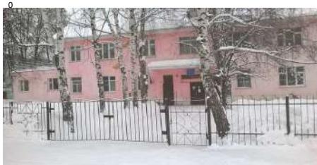
Фото на странице: 0